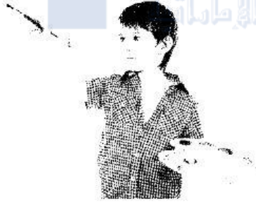
يرسم لوحة جميلة

2. اَكْتُبْ جُمْلَةً تُعَبِّرُ فِيهَا عَمَّا يَفْعَلُهُ الطَّالِبُ: