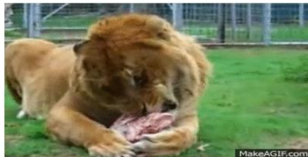
لديها أسنة مغطاة بنتوءات مدببة و خشنة لنزع اللحوم من العظم و أسنان طويلة و حادة