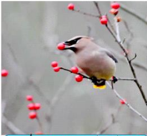
تلتقط الطيور الديدان أو البذور بمناقيرها