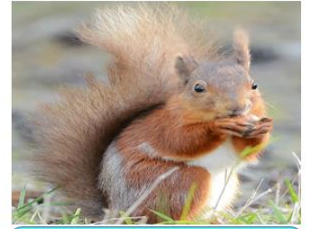
يستخدم السنجاب مخلبه و أسنانه الحادة ليلتقط ثمرة الجوز