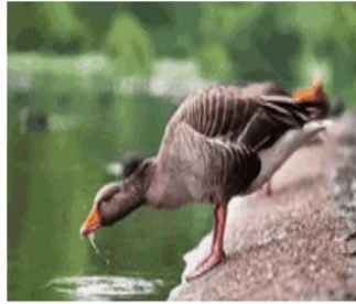
تشرب الطيور الماء بمناقيرها