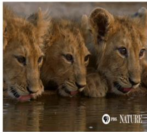
لسان الأسد طويل يساعده على شرب الماء