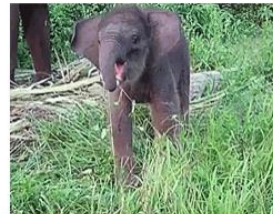
ترفع الأفيال الماء و تسحب النباتات بخراطيمها