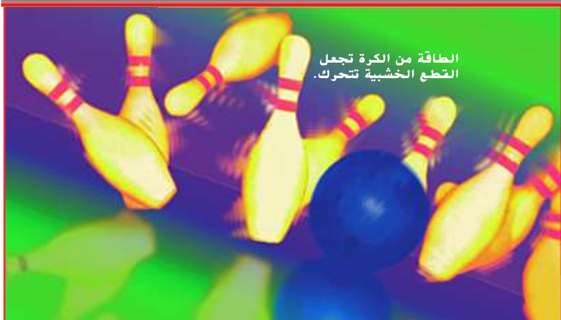
الطاقة من الكرة تجعل القطع الخشبية تتحرك.