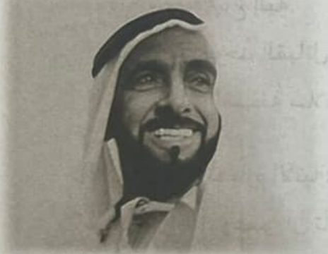
الشيخ زايد بن سلطان آل نهيان -رحمه الله الباني المؤسس للاتحاد

لاخَ نَجْمِ السَّعْدِ فِي بَابِ العِلا ... مَجْدُهُ باقٍ على رَغْمِ المَعاندِ