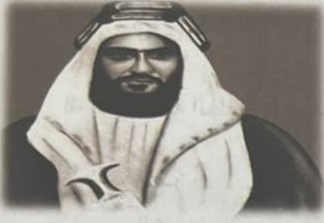
الشيخ سلطان بن زايد آل نهيان -رحمه الله

اقرأ الفقرة الآتية من ثلاثية الشيخ زايد "نجم السَّعد"، ثم أجب عن الأسئلة التي تليها: