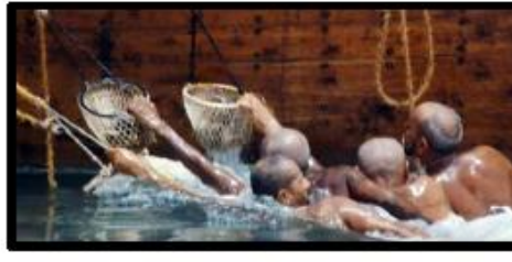
الغوص على اللؤلؤ