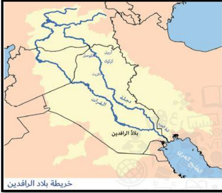
خريطة بلاد الرافدين

مراجعات نهاية الفصل الدراسي الأول للصف الخامس