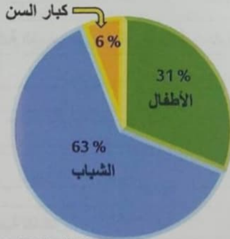
نسبة الفئات العمرية للسكان في سلطنة عُمان عام 2020