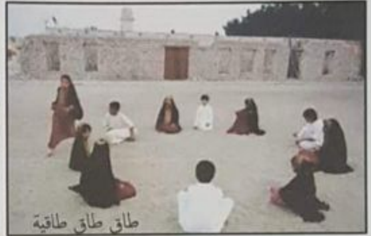
طاق طاق طاقية