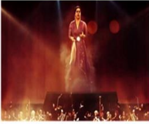
أوبرا سيدني بعد افتتاح المسرح بعد أكثر من 100 سنة من ولدها

إِسْتُخْدِمَتْ مُؤَخَّرًا تَقْنِيَةُ الهُولُوجْرَامِ فِي ظُهُورِ فَنَّانِيْنَ رَاحِلِيْنَ مُنْذُ زَمَنِ بَعِيدٍ، عَلَى حَسَبِ المَسْرَحِ أَمَامَ جَمَاهِيرِهِمْ مَرَّةً أُخْرَى، وَكَأَنَّهُمْ أَحْيَاءُ يَتَحَرَّكُونَ وَيُؤَدُّونَ فَتَّهْمَهُمْ، كَانَ آخِرُهَا هَذَا العَامَ عِنْدَمَا ظَهَرَتْ الفَنَّانَةُ الرَّاحِلَةُ أُمُّ كَلْتُومَ عَلَى مَسْرَحِ "دبي أوبرا" فِي أَكْثَرِ مِنْ حَفْلٍ فَنِّيٍّ.