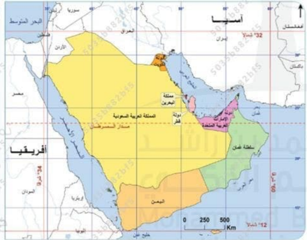
خريطة شبه الجزيرة العربية السياسية