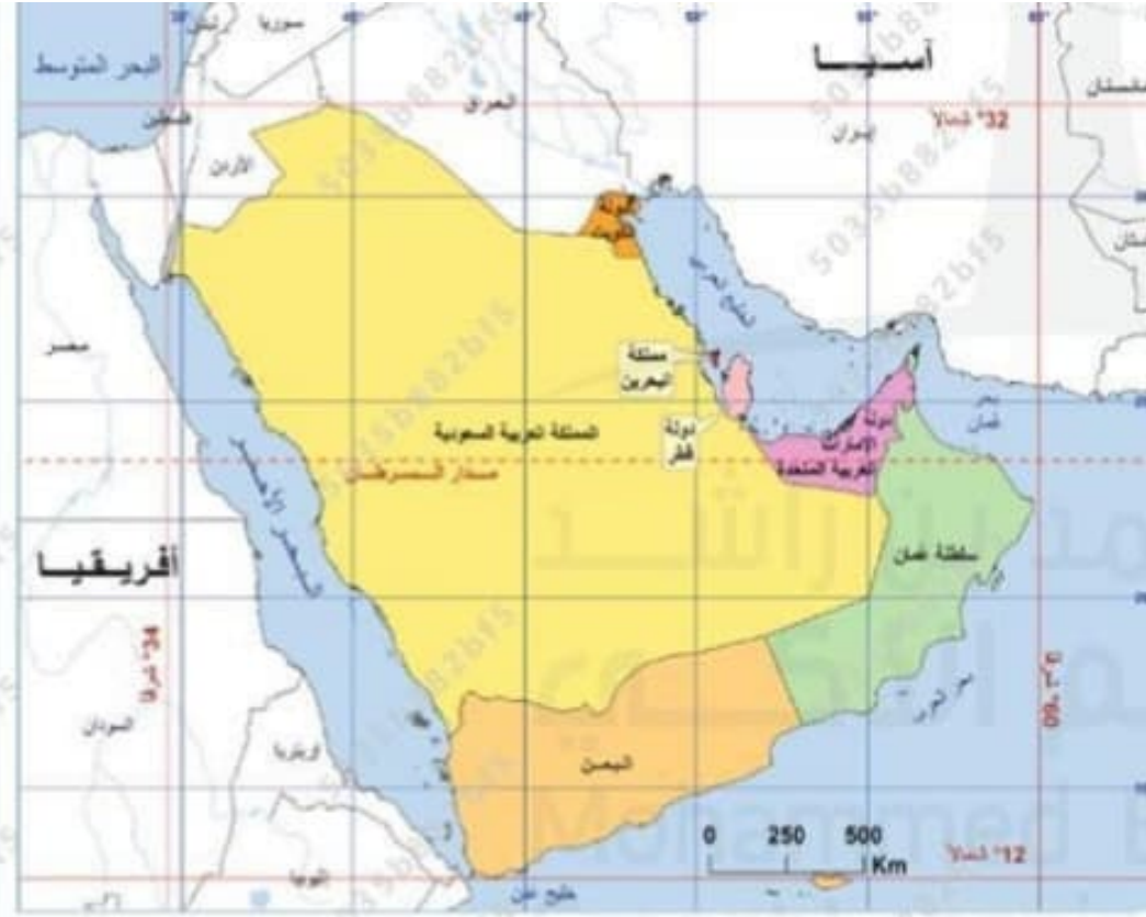
خريطة شبه الجزيرة العربية السياسية